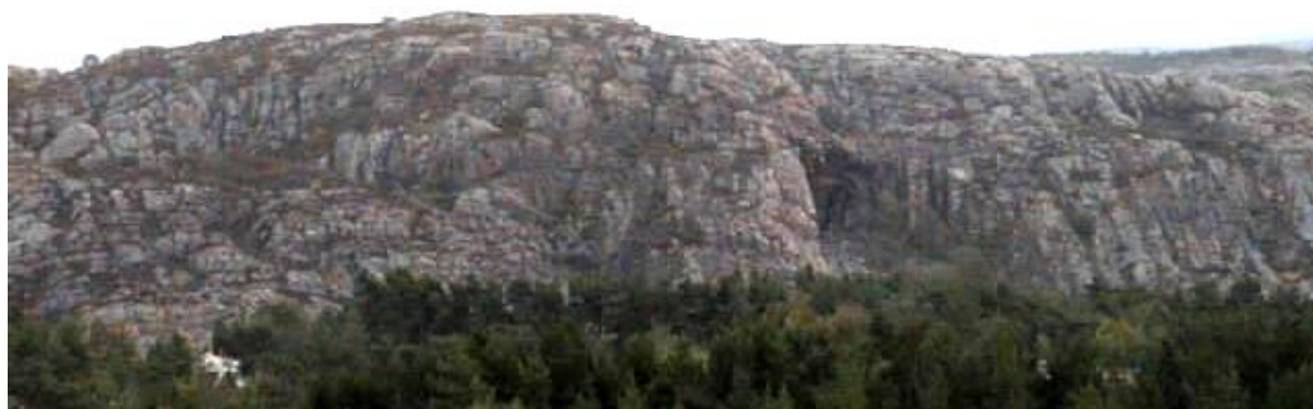
Trälleberget sett från Brattåsen

En intressant iakttagelse är att den gamla ortsbefolkningen på södra sidan av kilen idagligt tal kallade berget Träleberg (Träleökullen) medan folket på norra sidan oftast använde namnet "Köven". Det ordet är antagligen norskt och står troligtvis för dagen ord rum. Berget har ju en stor rumsliknande urgröpfung mot sjösidan. När folk i dag använder ordet "Köven" är det nog denna del av berget man avser och inte hela Träleberget.