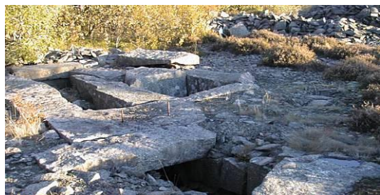
Storbrottet vid Brattås

Tidigt började man dock med storbrott och ett bland de första i nedre Lyse var det i Brattås. Det var mest byggnadssten man högg där. Dit anlade man räls från lastkajen i Spjösvisbukten. En räls slinga gick också uppåt "Berge mark" där ett otal större och mindre brott togs upp. Rälsgreningen var vid "Bracka". Troligen gick det också en räls slinga från "Bracka" till stenbrotten vid Dammen. "Raller" kallades vagnarna som kördes på rälsen dragna av hästar. Spårbredden var omkr. 60 cm. Ovanför Bracka i en brant sluttning hade man anordnat med en linbana "lift" Det var dubbla räls spår och så ordnat att nedåtgående lastade vagnar drog upp tomma vagnar mot brottet i Brattås.