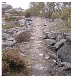
Rälsväg Storbrott / Brattås-Bracka