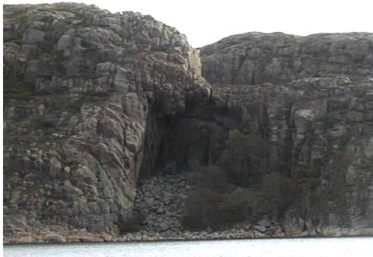
"Köven" vid Trälleberg

Oavsett om man kommer till Lyse-Berga området med bil eller båt så är det Träleberges mäktiga profil som man först lägger märke till. Varifrån kommer då detta namn? Har det något med trälar att göra? Troligtvis inte. I gamla längder kan man se att stavningen av namnet har varit ganska lika genom tiderna. År 1550 stavades det Threlleberg. 1703 Trolleborg samt senare Trälleberg och Trälleberg.