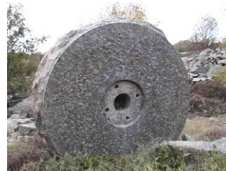
Kvarnstenen vid Bracka