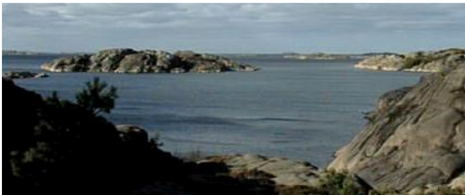
Käringholmen sett från Hammarvik

Naturligtvis kan man komma till Lyse-Berga sjövägen. Även då domineras topografin av Trälebergets profil. De inre farlederna är förvånansvärt djupa och breda. Det är väl endast om man väljer att gå in norr om Käringholmen vid "Blykula" som den oförsiktige kan fastna på "Grytebena" vid Dyskär