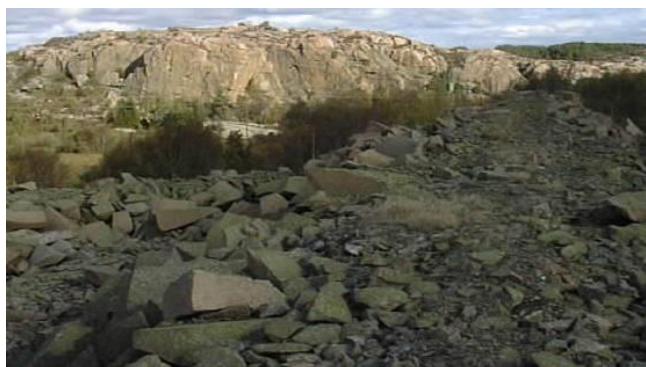
Bilden tagen från "Plöse" mot Brattås