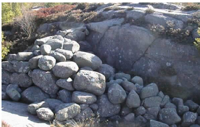
Predikstolen ovanför Sövikstigen

Någon har sagt att "transporterna är oljan i samhällsmaskineriet" Möjligheterna att transportera både människor och gods till och från Lyse-Berga området har och är goda. Alltså fanns här bra förutsättningar för människor att livnära sig på de resurser som fanns i området och dess omedelbara närhet. Många är också spåren efter människors olika aktiviteter både uppe i bergen och nere vid stranden. Vid Hästepall fanns ett tranškokeri. Spåren efter själva tranškokeriet och dess grumsedamm kan man än i dag skönja men var mera påtagliga innan området exploaterades.