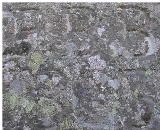
Inskriften P:B.B. 1803

En predikostolsliknande anordning finns vid berget ovanför Hästepall. I berget är följande text inhuggen "P.B.B.1803" men troligtvis är "predikstolen", som den heter i folkmun, mycket äldre.. Enligt sägen skall en präst härifrån ha hållit predikningar för folk "uppifrånlandet" som besökte platsen under sillfiskeperioden (gästarbetare?) På 1870 talet var en ny sillperiod i antågande och nu hade man lärt sig att konservera sillen i plåtburkar. Inom själva Lyse-Berga området fanns dock ingen sådan industri. Den närmaste konserverfabriken låg i N. Grundsund och var verksam på 1950-talet. Fabriksbyggnaden finns ännu kvar men är omgjord till bostadshus.