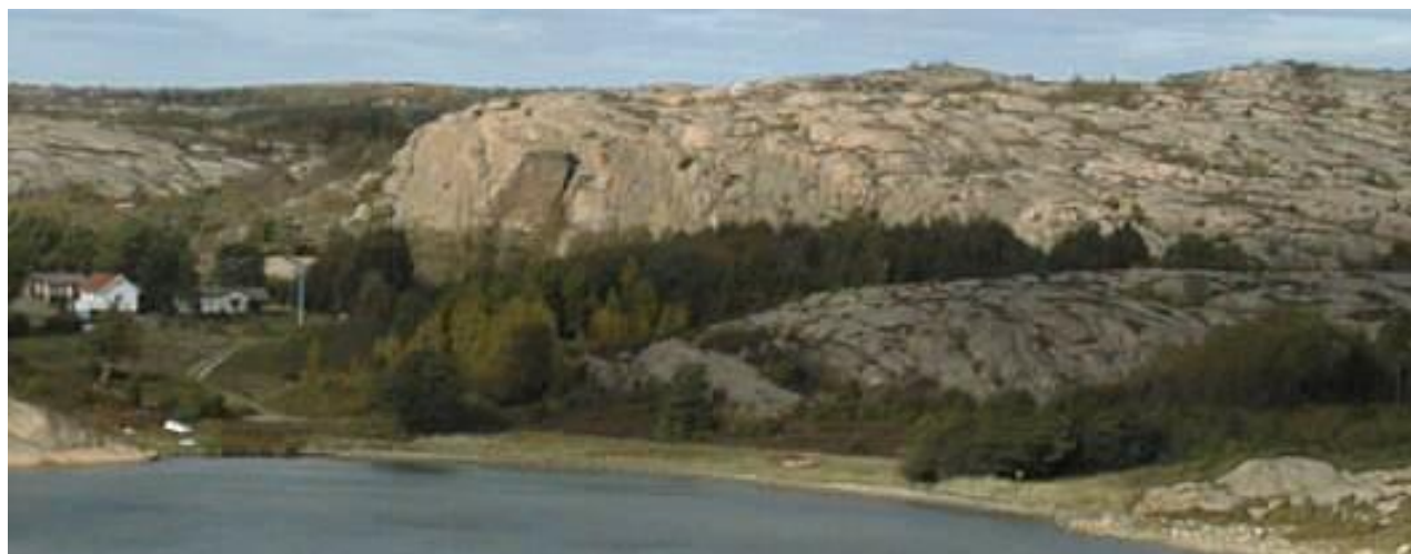
Brattåsen sett från Östensvik

På Brattåsen sluttning ned mot Trälebergsskilen utbreder sig i dag en bebyggelse som huvudsakligen består av fritidshus. Denna projekterades i slutet av 1950-talet. Området är avstyckat från fastigheterna Berga och Gåsehogen. Först benämndes området enbart för Berga. Inom kommunen fanns det flera Bergaområde varför namnet på det här området under 1980-talet ändrades till Lyse-Berga. Namnet Lyse (Liusse) tror man har att föra medljus i anslutning till vatten och omnämns 1317 i krönikorna. 1660 omnämns Berga som en halv gård i Sundsby jordabok,