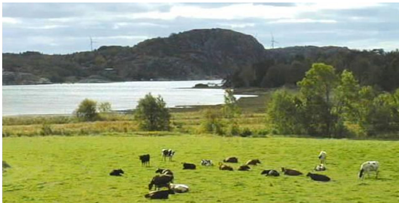
Träleberget sett från Kyrkan

Vägen rundar sedan berget Hällern på höger sida och när du passerat "Hälle"-kurvorna dyker plötsligt Lyse-kyrka med sin kyrkoruin upp framför dig. Strax efter kyrkan gör den allmänna vägen en 90-graders sväng åt höger. Tar du i stället av åt vänster på den mindre vägen kommer du in på Lyse-Berga området där vägföreningens trevliga skylt hälsar dig välkommen med förhoppning om att du skall köra försiktigt.