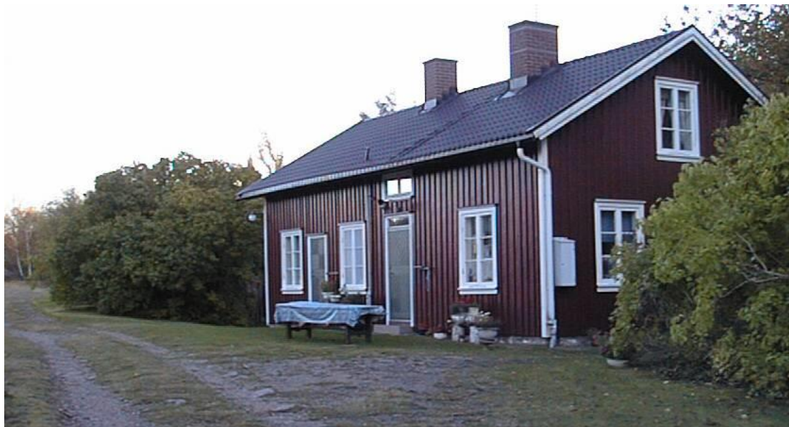
Brackå år 2003 som en gång var knutpunkten för räls slingorna