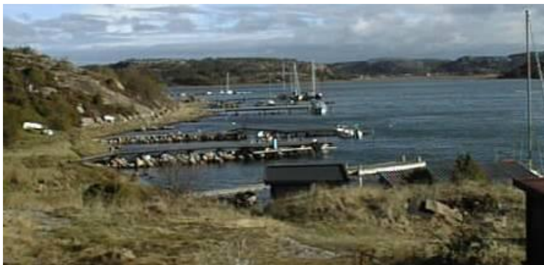
Bilden tagen från Hästepallen mot Skutebacken