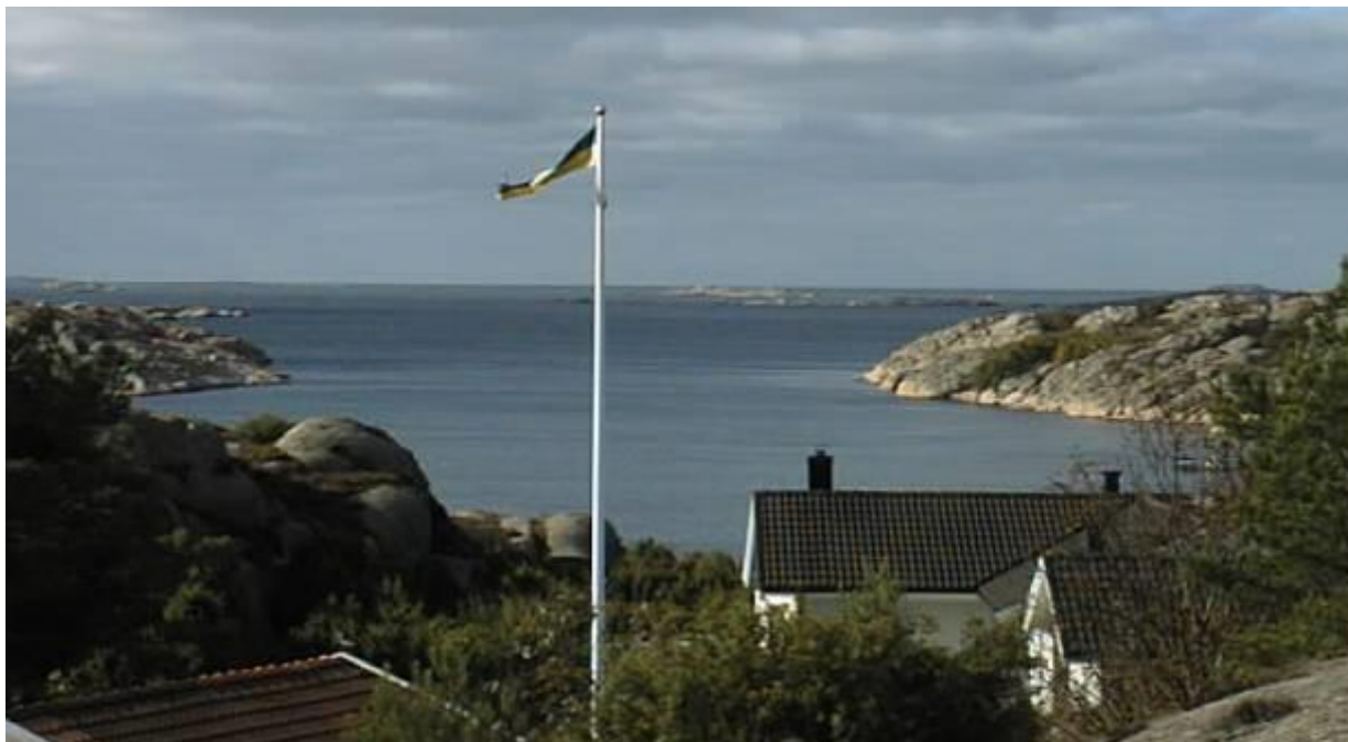
Vy mellan Käringsholmen och "Blykula"